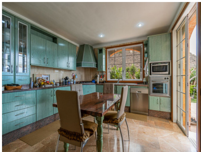
Cocina y comedor