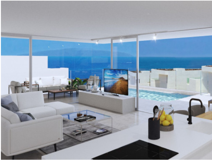
Salón y cocina