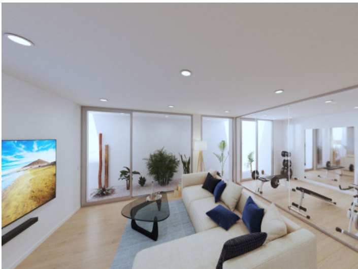
Salón y gimnasio