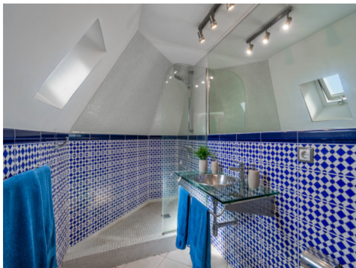
One of 2 bathrooms