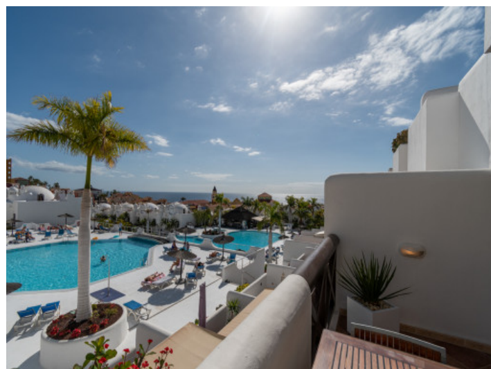
Fantastic pool area

Toda la información como mejor se puede saber, salvo por error durante el periodo de venta. Sirva este documento como un informe previo, las bases legales solo serán válidas a traves de un contrato de compra acordado ante Notario.