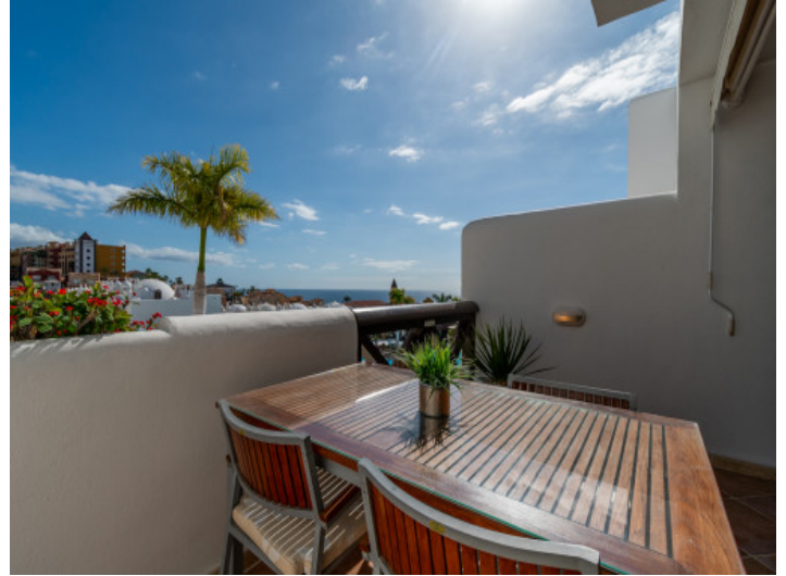
Outdoor dining area