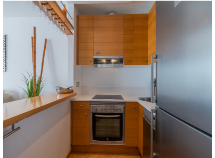
Timeless kitchen design