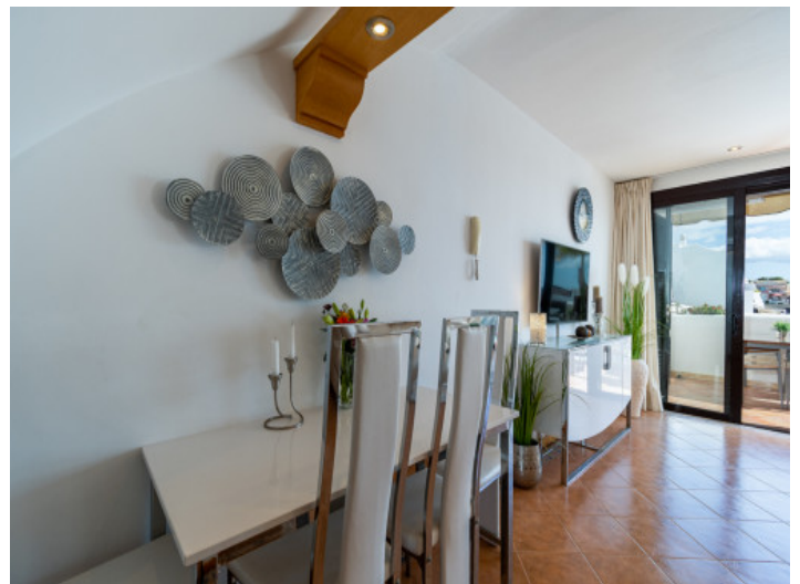
Beautiful dining area

Toda la información como mejor se puede saber, salvo por error durante el periodo de venta. Sirva este documento como un informe previo, las bases legales solo serán válidas a través de un contrato de compra acordado ante Notario.