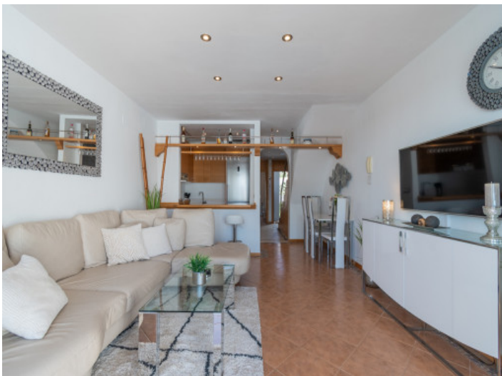
Open plan living and dining area