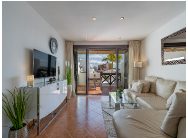
Elegant living area