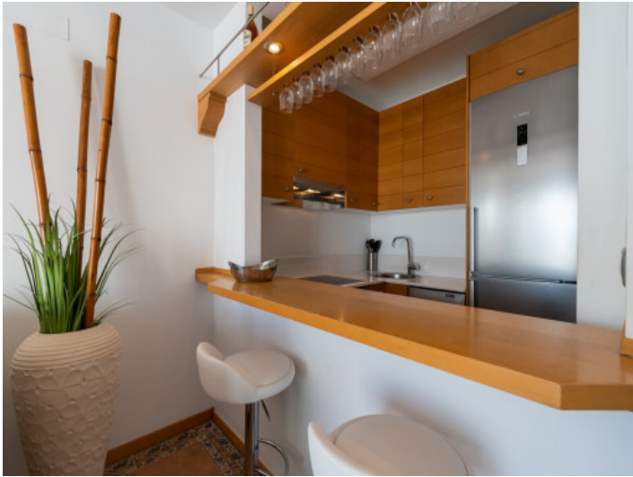
Fully fitted kitchen