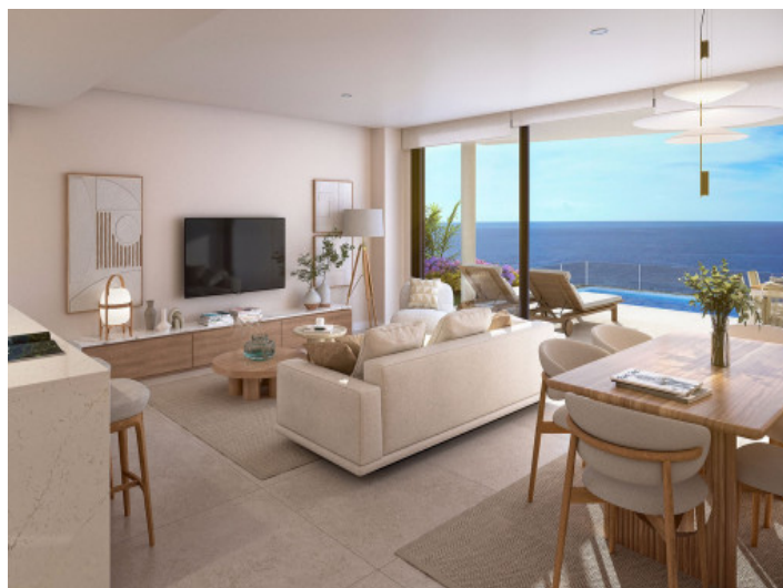
Salón y comedor

Toda la información como mejor se puede saber, salvo por error durante el periodo de venta. Sirva este documento como un informe previo, las bases legales solo serán válidas a través de un contrato de compra acordado ante Notario.