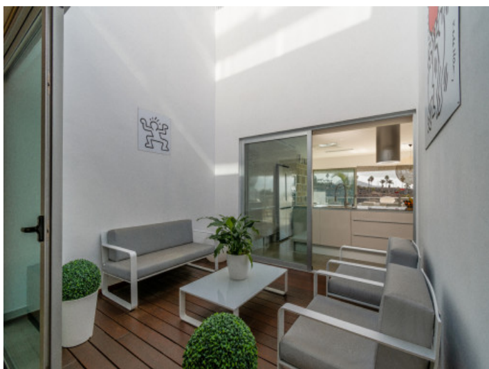
Área de estar