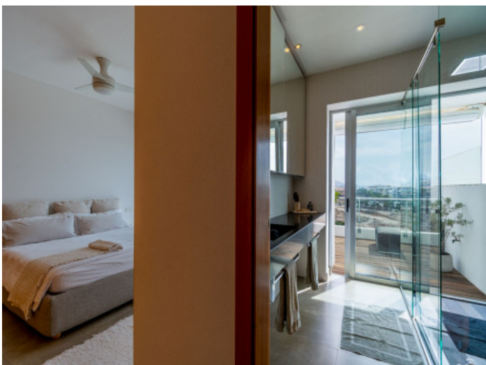
Dormitorio y baño