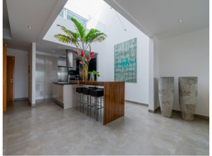
Cocina y comedor