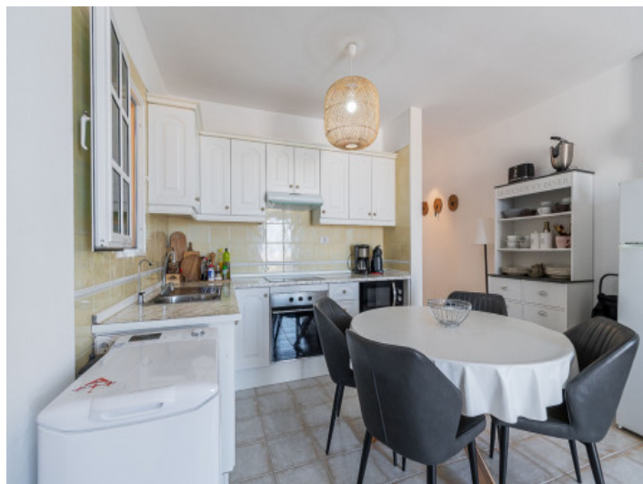
Comedor y cocina