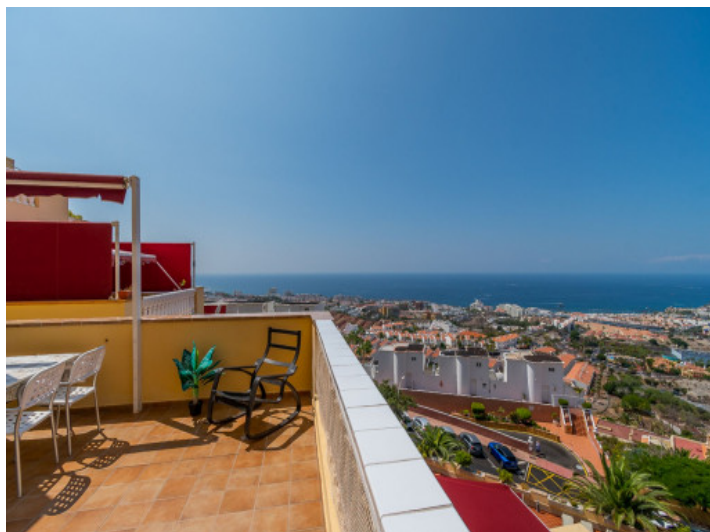
Terraza con vista mar