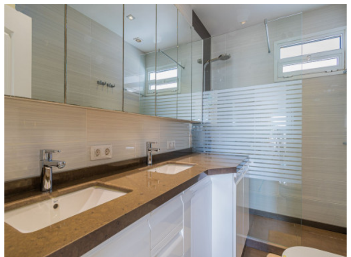
El apartamento tiene 2 baños

Toda la información como mejor se puede saber, salvo por error durante el periodo de venta. Sirva este documento como un informe previo, las bases legales solo serán válidas a través de un contrato de compra acordado ante Notario.