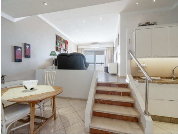
Comedor - Cocina