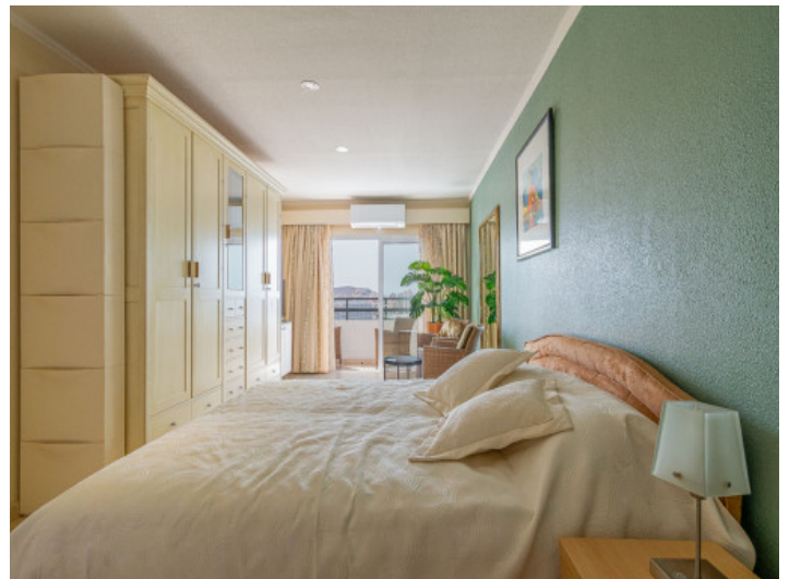
Uno de 2 dormitorios