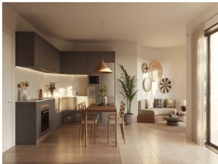
Salón y comedor