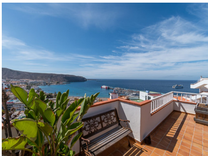
Vistas al mar