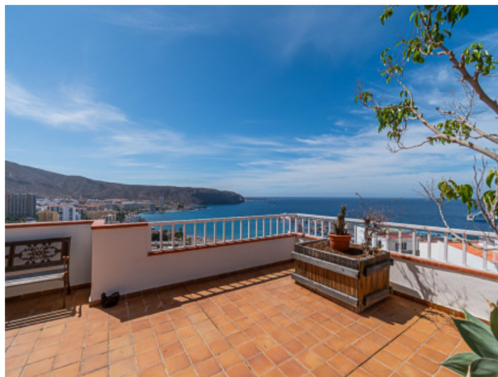
Vistas al mar