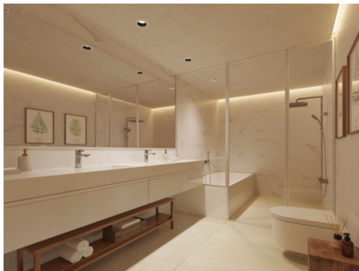
Uno de 3 baños