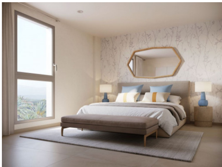
Uno de 4 dormitorios