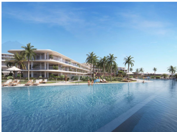
Exclusivo complejo residencial