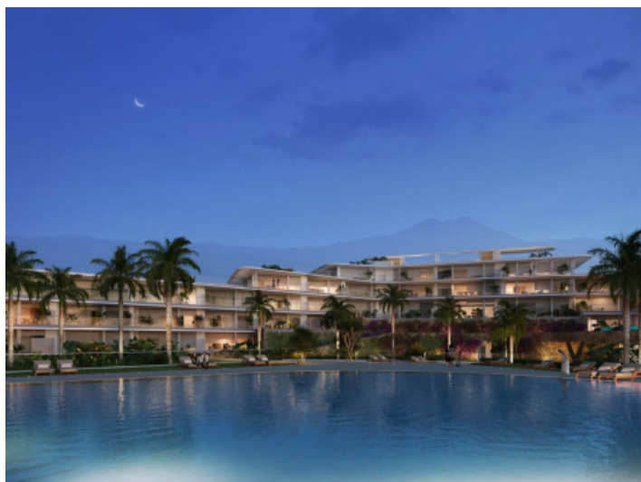
Complejo de lujo