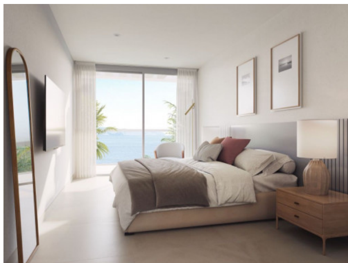
Uno de 4 dormitorios

Toda la información como mejor se puede saber, salvo por error durante el periodo de venta. Sirva este documento como un informe previo, las bases legales solo serán válidas a través de un contrato de compra acordado ante Notario.