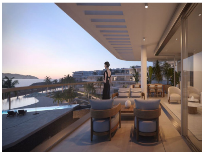
Terraza cubierta con vistas al mar