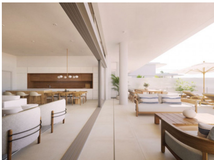
Terraza adyacente al salón