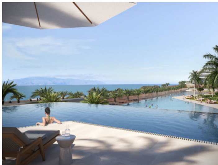
Amplia piscina comunitaria